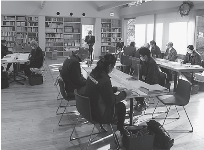
▲各グループに分かれ、地域の課題や困り事などについて話し合いました。

地区社協の代表が集まり、地域の課題について協議する地区社協連絡会を大和町の「短歌の里交流館よぶこどり」で開催しました。当日は市役所職員にも参加をしていただき、地区社協の近況報告の後、グループに分かれ「買い物支援」・「移動支援」・「サロン」をテーマに意見交換を行いました。情報交換では、買い物や移動で困っている方々への取り組みが紹介されたり、認知症カフェなどの開催場所としてお寺が好評であったなど様々な意見やアイデアが出ました。