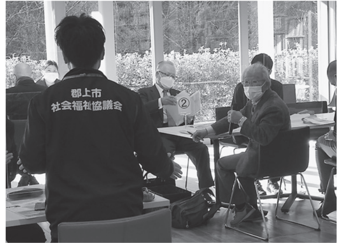
▲他の地域の気になる活動について、質問や意見が交わされ、お互いに情報を共有することができました。