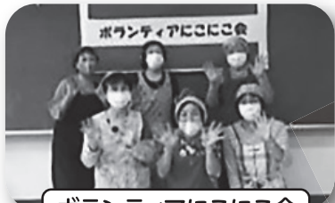
ボランティアにっこにこ会