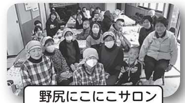
野尻にっこにこサロン