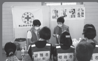
郡上市地区赤十字奉仕団 郡上市防災訓練への参加

赤十字奉仕団活動や、国内における災害救護活動を始め、医療・献血・各種講習会・青少年の育成、海外への医療スタッフの派遣、物資の配布などの救護活動、開発途上国に対する開発援助活動などにも活用しています。