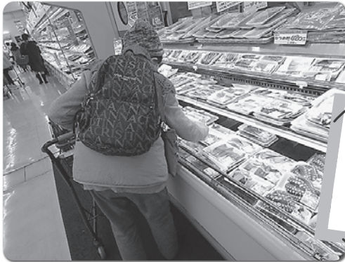
お買い物 ツアーの 様子

ひとり暮らしの方や高齢者のみで暮らされている方を対象にした「買い物ツアー」と、生活にお困りを抱え、郡上市社協に相談されている方々51世帯に対し、正月用品等をお届けする「歳末たすけあい応援事業」を今年も行いました。