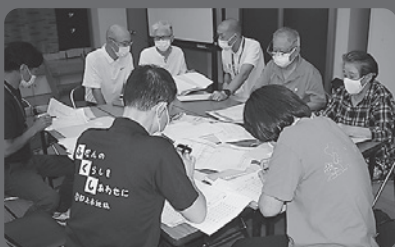
福祉懇談会の開催

地域福祉活動（地区社協活動、福祉委員活動、サロン活動、ボランティア活動、福祉情報の提供、高齢者等の生活支援、福祉共育（教育）活動や福祉車両貸与事業など）に活用しています。