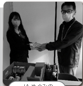
JAめぐみの 郡上地域 様