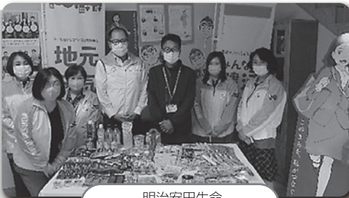
明治安田生命 岐阜支社 中濃営業所 様